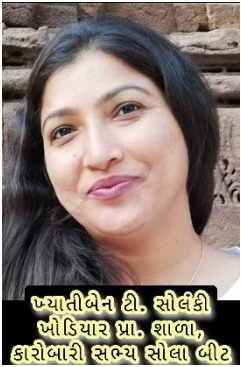
જ્યોતીબેન ટી. સોલંકી બોંદિયાર પ્રા. શાળા, કારોબારી સભ્ય સોલા બીટ