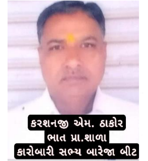
કરશનજી એમ. ઠાકોર ભાત પ્રા.શાળા કારોબારી સભ્ય બારેજા બીટ